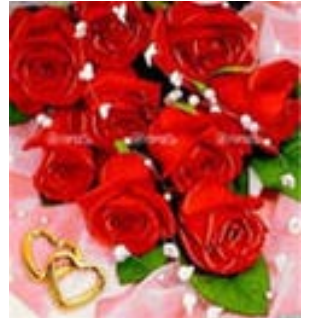
Сестра, дети и внуки.

Вы друг друга берегите, Уважайте и любите, Будут пусть сильней и краше С каждым годом чувства ваши. Пусть тепла и много света, Счастья, радости, привета Будет много в месте том, Что зовется просто – дом! Серебряная вновь не повторится, Желаем вам дожить до золотой, Пусть в сердцах навеки сохранится Волшебный луч от жизни молодой!